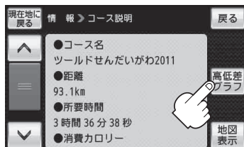
(例)KMLコース説明画面

: 高低差グラフ付きKMLコース地図画面が表示されます。KMLコースのシミュレーション走行を行うことができます。