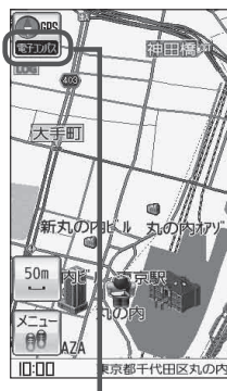
電子コンパス状態表示