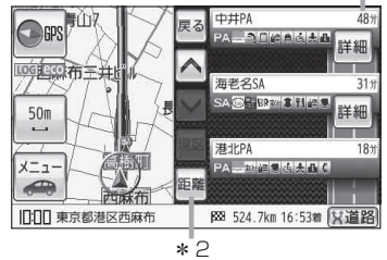
(例)ハイウェイモード * 1

: ルート探索をしてルート案内に従って高速道路や有料道路を走行時のみ、ルート情報を表示します。