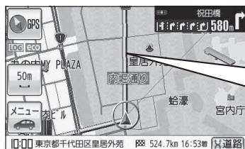
(例)ルート案内画面