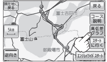
(例) 高低差グラフ付きKMLコース地図画面