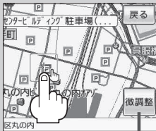
微調整 ボタン B-18