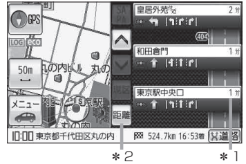
(例)自動車モード時のルート情報画面

: ルート探索をしてルート案内に従って走行しているとき、道路名称、曲がるべき方向、レーン案内、所要時間/距離などを表示します。