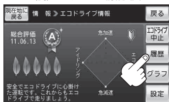
(例)エコドライブ情報画面