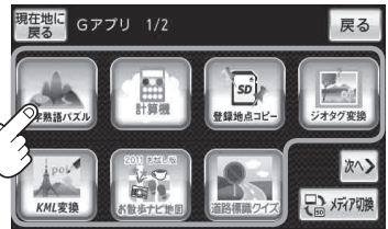
(例) Gアプリ一覧画面