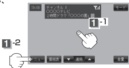
操作ボタン表示画面