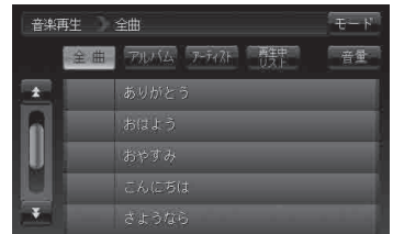
音楽再生一覧画面(例)