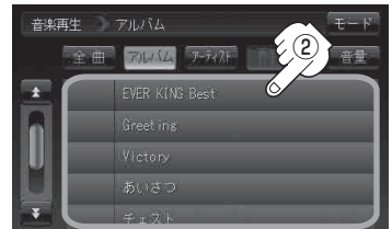
アルバムリスト画面(例)