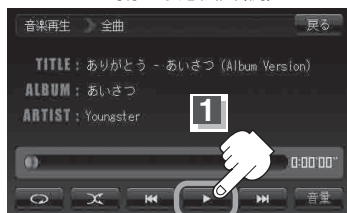
一時停止状態画面(例)