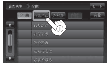
全曲リスト画面(例)