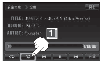
ランダムボタン(ランダム)