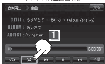
ランダム ボタン(ランダム)