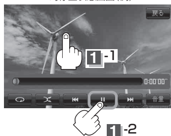
一時停止状態画面(例)