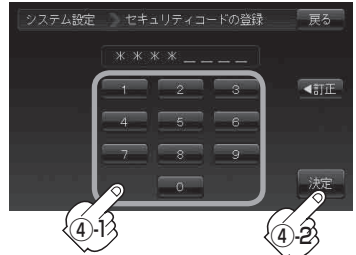
セキュリティコード入力画面