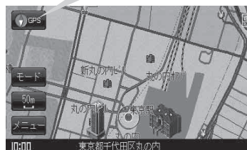
現在地表示画面(例)