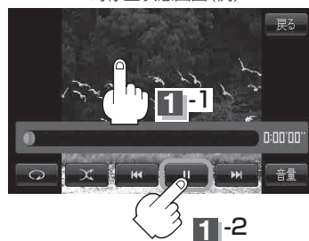
一時停止状態画面(例)