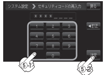
セキュリティコード入力画面