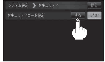
セキュリティ設定画面