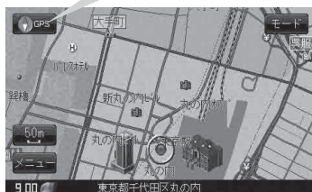
現在地表示画面(例)