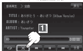
ランダム ボタン(ランダム)