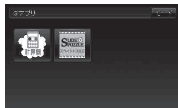
Gアプリ一覧画面(例)