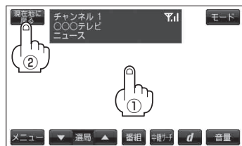
(例) テレビ視聴(ワンセグ)画面