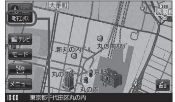
電子コンパス状態表示