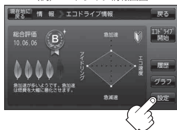
(例)エコドライブ情報画面