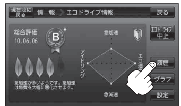
(例)エコドライブ情報画面

：エコドライブ評価履歴画面が表示されます。 今までの評価履歴が最大30件まで日付の新しい順に表示されます。