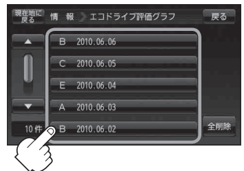
(例)エコドライブ評価履歴画面