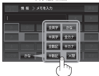
(例) 全カナ を選択した場合