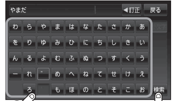
電話番号登録者名入力画面*

※該当するデータが収録されていない場合は地図は表示されません。入力した名字を確認のうえ、もう一度入力し直してください。