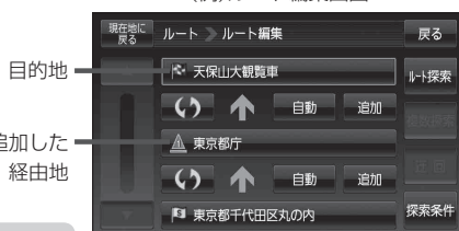
(例)ルート編集画面