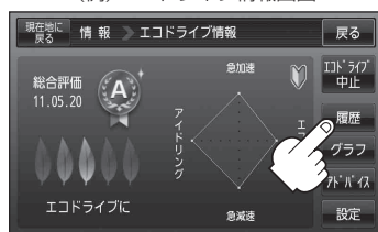
(例)エコドライブ情報画面