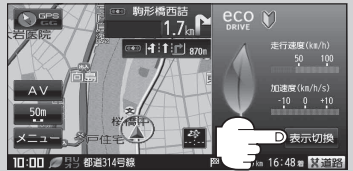
(例)走行速度・加速度インジケータを表示