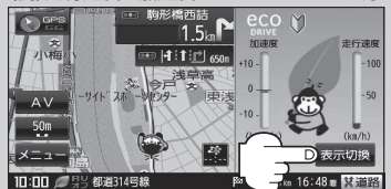
(例)走行速度・加速度インジケータを表示