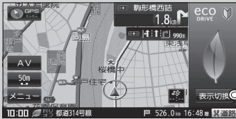
(例)アニメーションを表示