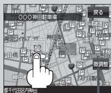
微調整 ボタン [B-21]