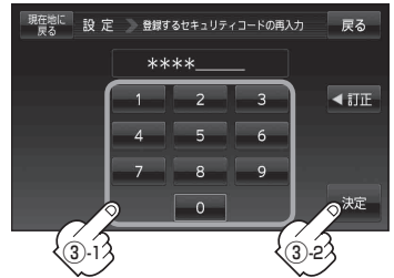
セキュリティコード入力画面