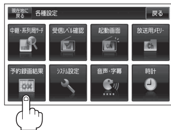
(例) 予約録画結果画面