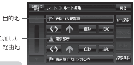
(例)ルート編集画面

☞ D-10の手順 5 へ、経由地追加画面が表示された場合は、下記手順 3 へ進んでください。