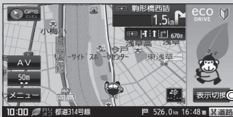
(例) アニメーションを表示