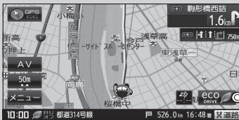
(例) ECO DRIVEのみ表示