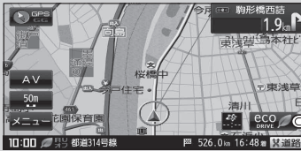
(例) ECO DRIVEのみ表示