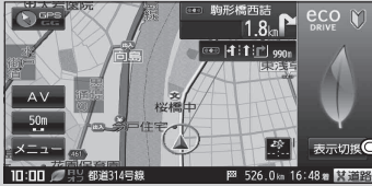
(例) アニメーションを表示