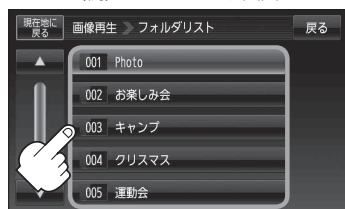
(例)フォルダリスト画面