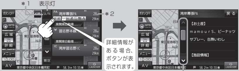
情報のつづきを表示