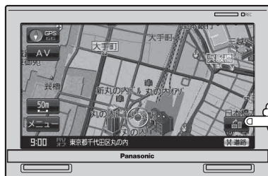
(例) 地図横表示画面