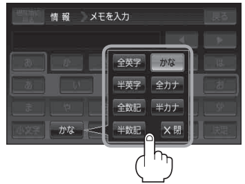
(例) 全カナ を選択した場合