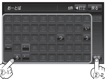
ジャンル名入力画面* 1

お知らせ * 1印…50音入力画面を選択することができます。☞ 「50音入力方式設定をする」M-7