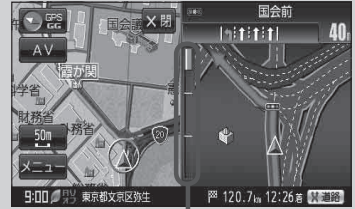
(例) 交差点拡大表示