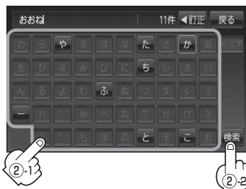
地名50音検索入力画面*2