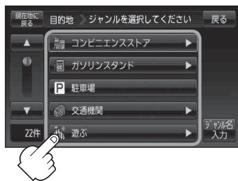
ジャンル選択画面