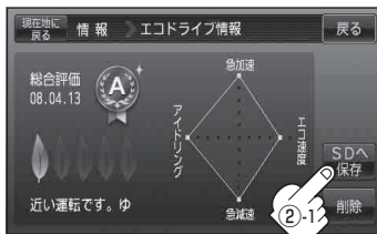
(例)エコドライブ評価履歴の詳細画面