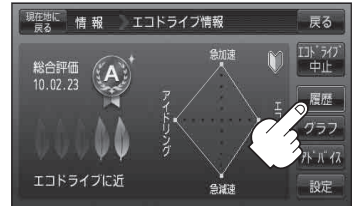
(例)エコドライブ情報画面