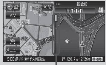
(例) 交差点拡大表示

・データは地図ソフト作成時のものであるため、表示された内容(ランドマークなど)が実際とは異なる場合がありますので、ご注意ください。