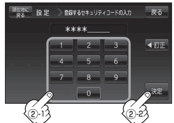
セキュリティコード入力画面