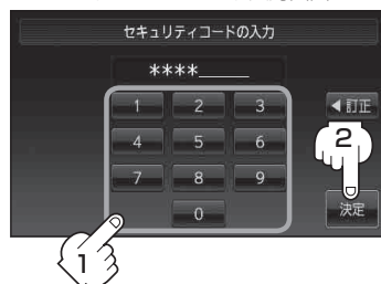
セキュリティコード入力画面

※メッセージが表示された場合は、メッセージを確認し OK をタッチしてください。