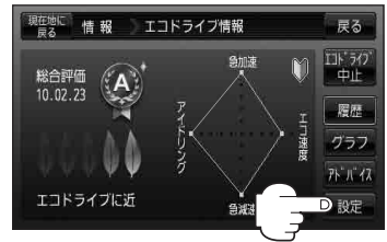
(例)エコドライブ情報画面