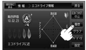
(例)エコドライブ情報画面