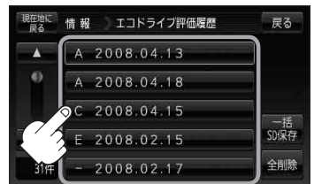
(例)エコドライブ評価履歴画面

：選択された日の評価履歴をSDカードへ保存してもいいかどうかのメッセージが表示されるので はい をタッチすると履歴を保存し、 OK をタッチするとエコドライブ評価履歴の詳細画面に戻ります。