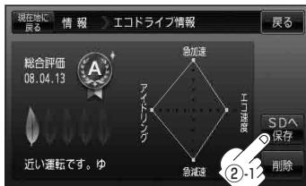
(例)エコドライブ評価履歴の詳細画面