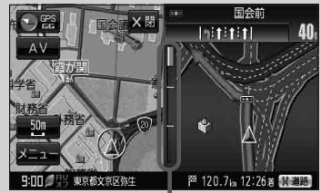
(例) 交差点拡大表示